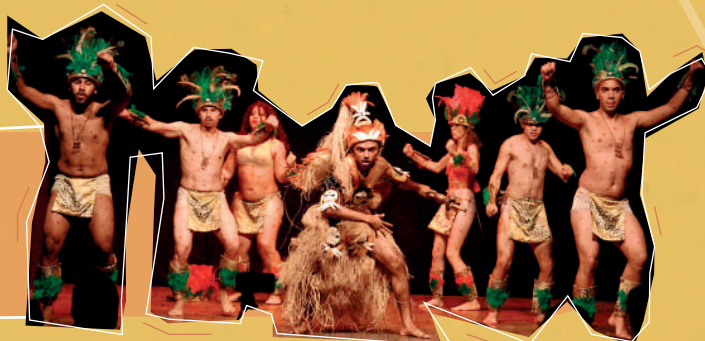
Oré Anacã - Grupo de Dança Popular da UFC

Programação e inscrições: www.secultarte.ufc.br