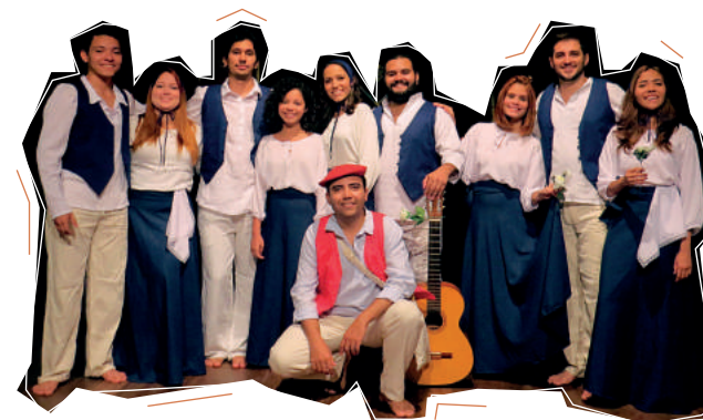
Grupo Verso de Boca (UFC)

A apresentação mergulha no universo das cantigas trovadorescas e dos romances orais da tradição ibérica e realiza uma performance poética reunindo a poesia de outros períodos literários e de poetas modernos e contemporâneos.