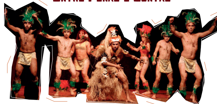
Oré Anacã - Grupo de Dança Popular da UFC

O espetáculo reúne danças tradicionais brasileiras de influência étnica negra e indígena, como o boi bumbá, carimbó, siriri, afoxé, frevo, maracatu, congado, reisado, entre outras. O espetáculo será apresentado pela primeira vez em Sobral.