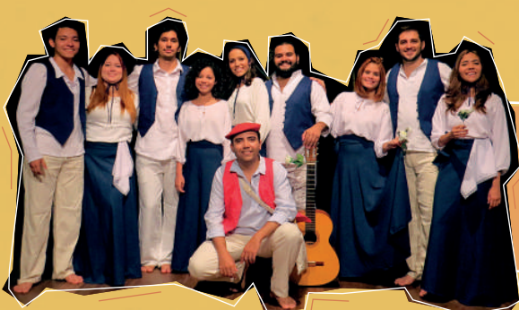
Grupo Verso de Boca (UFC)